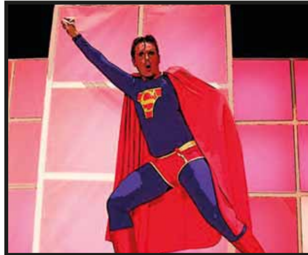
Por suerte, para velar por todos está... ¡SUPERMAN!