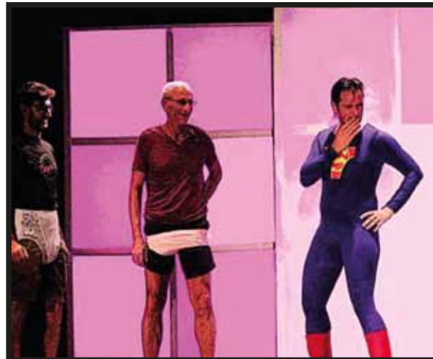
... y con la ayuda de nuestro querido público.