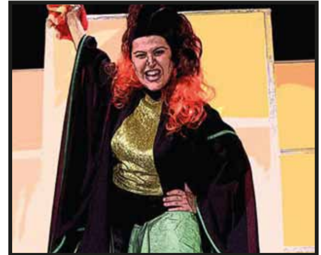
Pero... ¿qué pasaría si a Superman le robaran su fuente de poder?