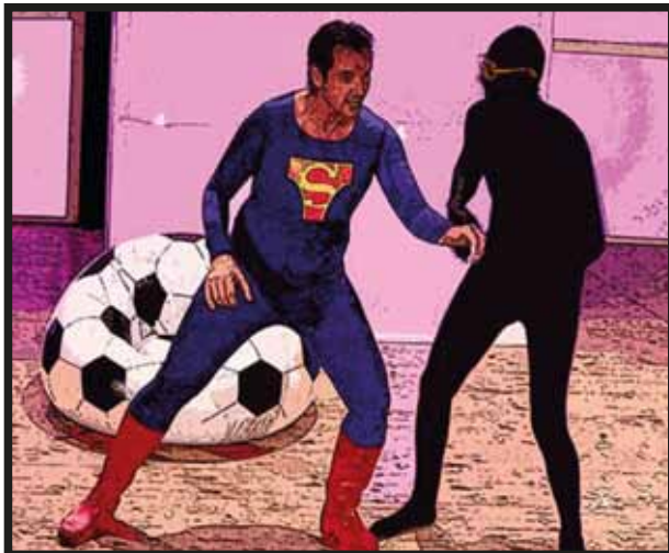
Contará con la ayuda de un amigo especial para recuperar lo que es suyo...