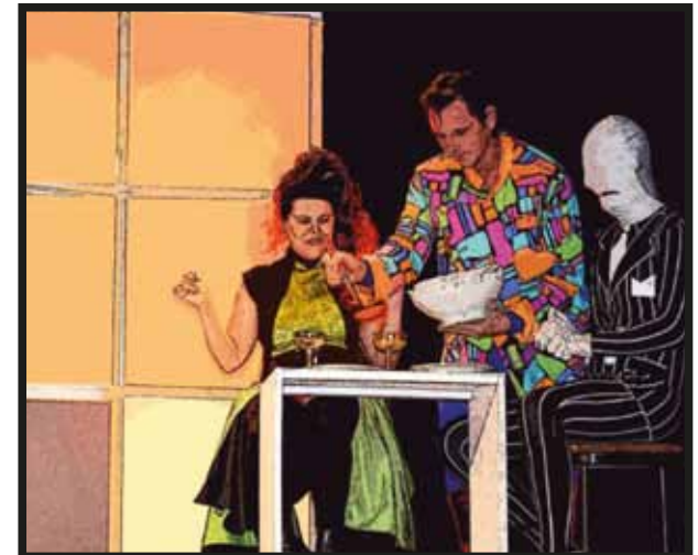
Urdirán planes para introducirse en casa del enemigo. Sin sus poderes, sólo podrá usar lo que le queda, el cerebro.