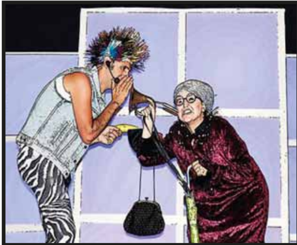
¡Vilacity está llena de peligros! Y las dulces ancianitas pueden ser asaltadas en cualquier momento!